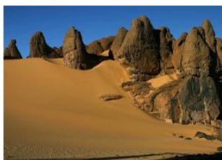
Oued Tahassa 📍