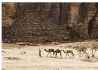
Oued Tanhart 📍