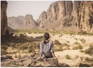
Oued Carana 📍