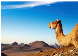
In Fergan. 📍