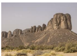
Mont Tahat 📍